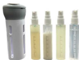
[화장품 키트 및 클렌징 워터, 스킨 토너, 오일 앰플]